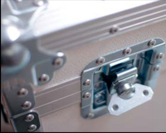
Flight-Case (LxBxH): 1630 x 610 x 1040 mm 89 kg inkl. iTVi.

Stabiler, einfach aufstellbarer Standfuss für 55" Display.