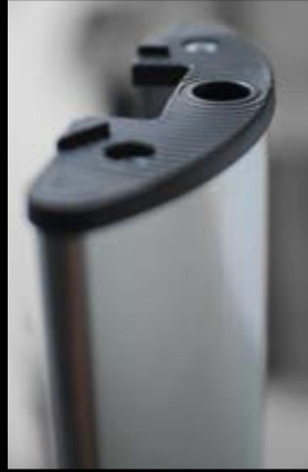
Standrohr aus Aluminium zum Einhängen des Displays.