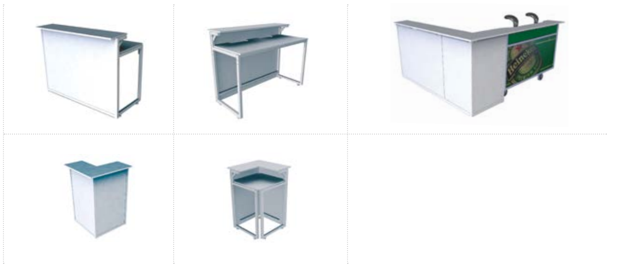
Degustationsstand am Hauptbahnhof Zürich.