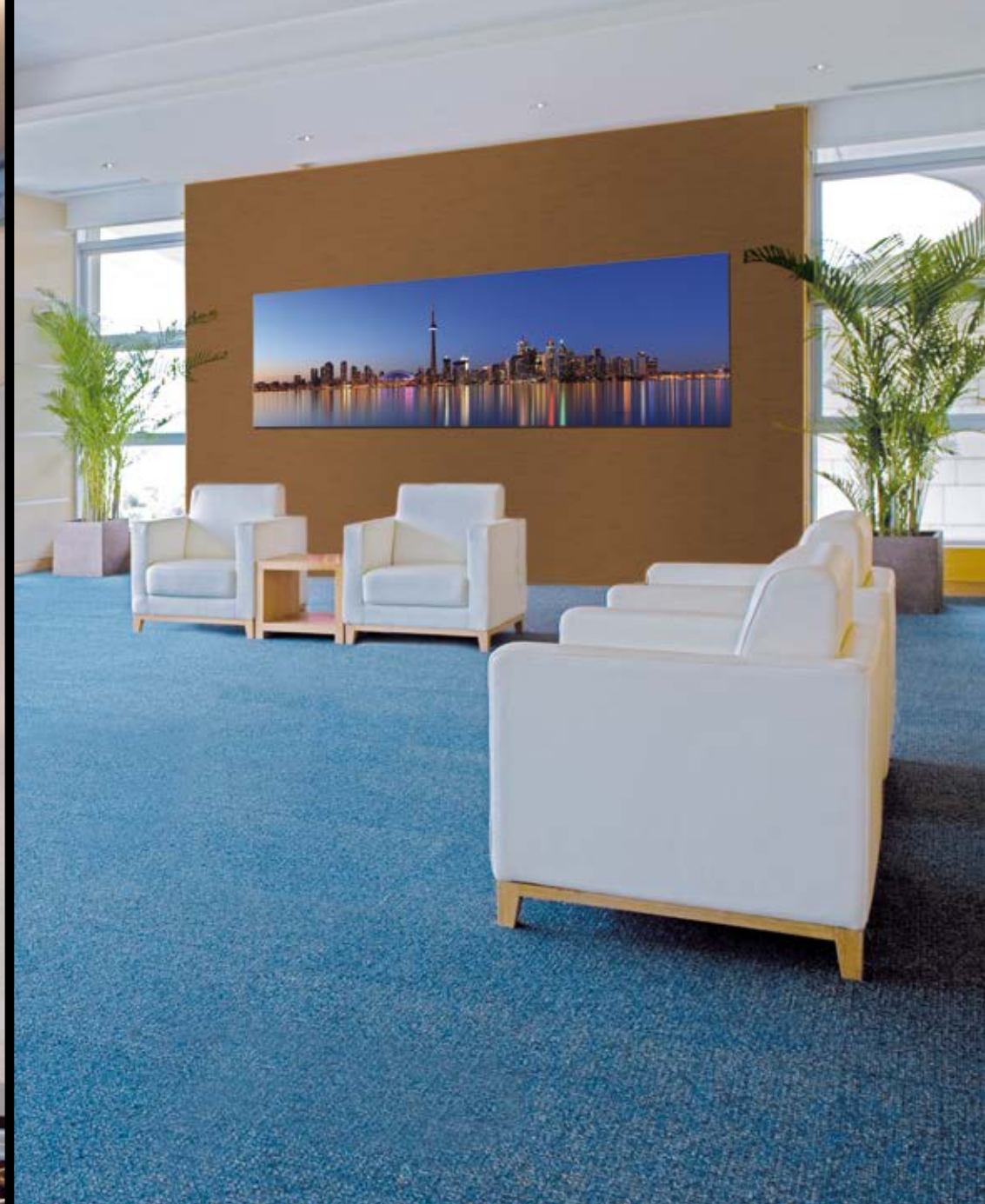
Praktisch: Sujetwechsel mit wenig Handgriffen.