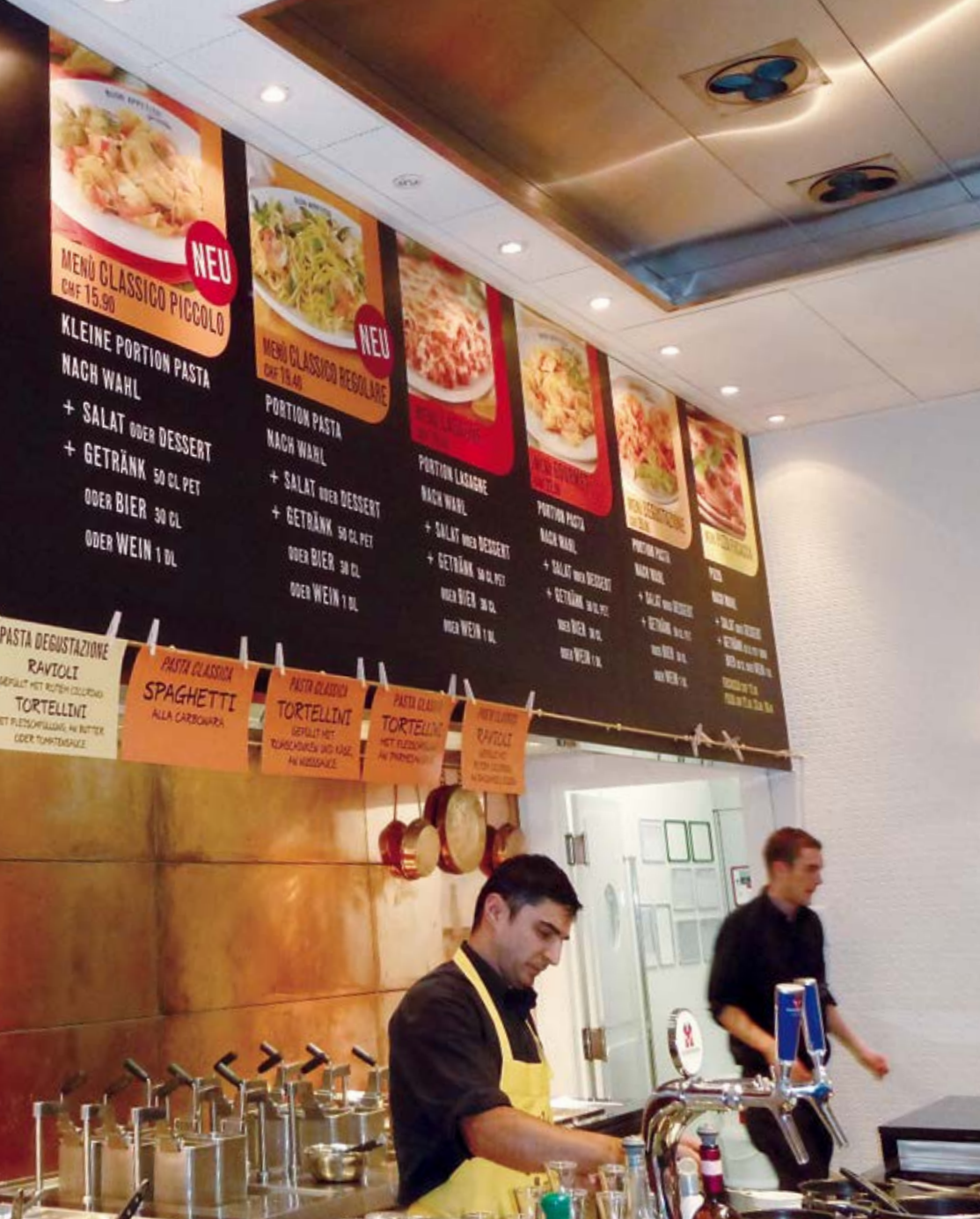
Einsatz in der Gastronomie: einfach auswechselbare Menüboards – auch für grossformatige Bilder.