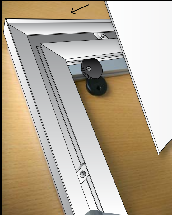
Asymmetrische Wandhalterung für exakte Montage