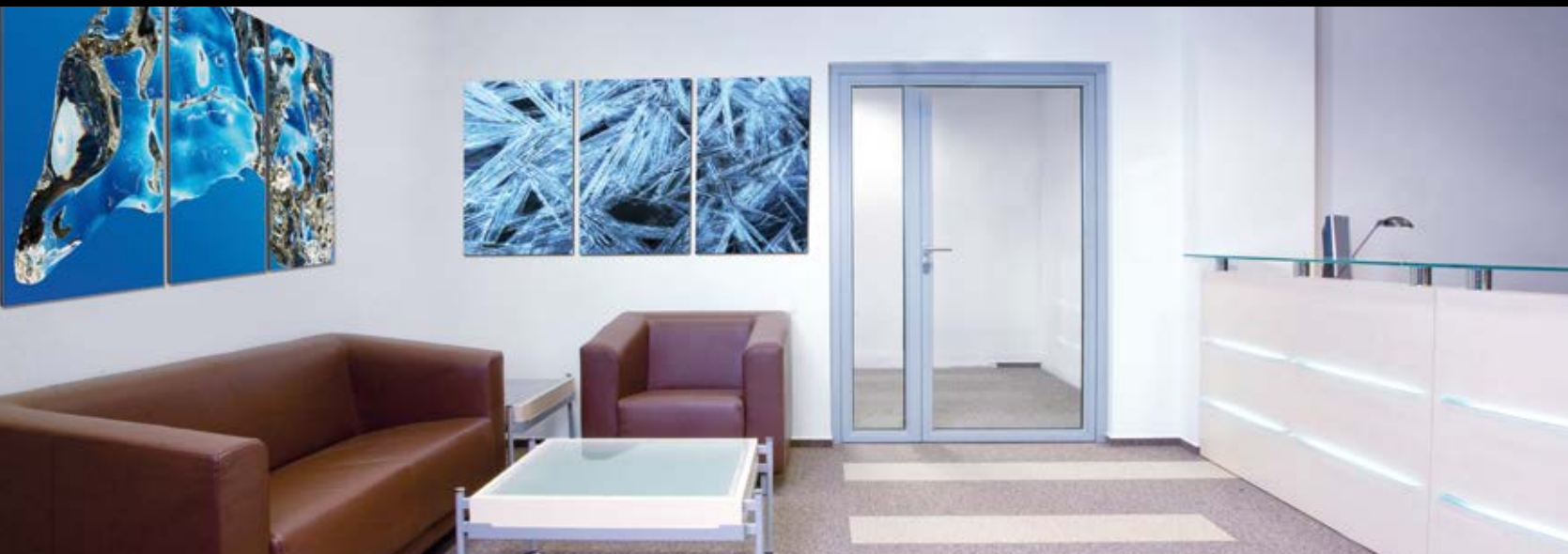
Wandbilder mit Doppelnutzen.