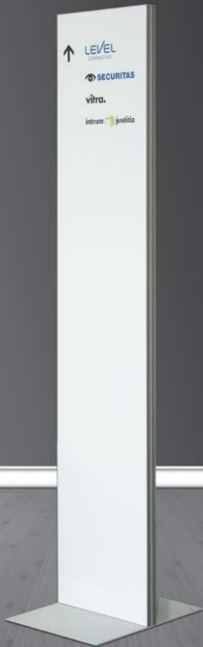
Infostele für flexiblen Einsatz