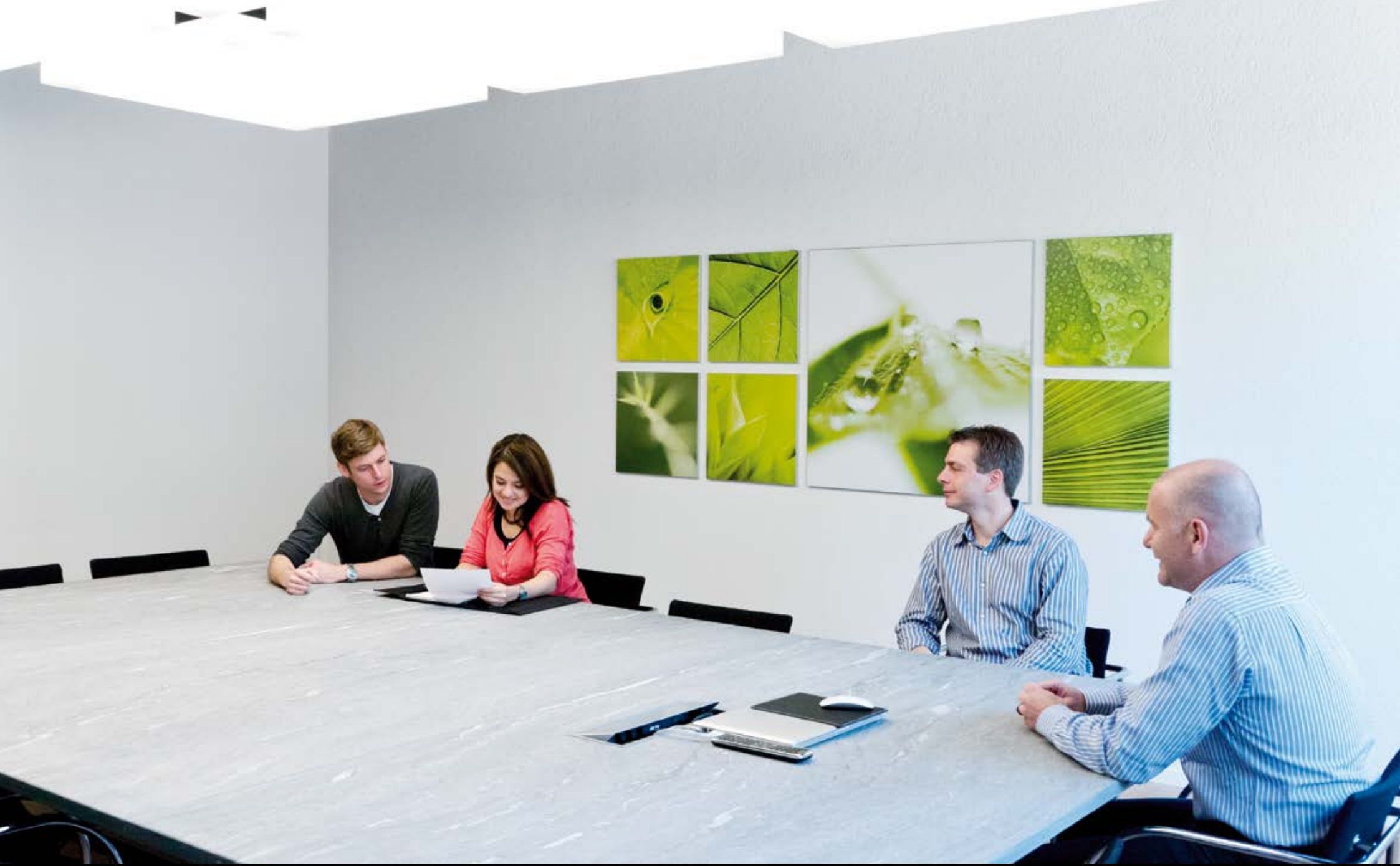
Schöne Alternative zum Flipchart: wendbares Bild, rückseitig mit Whiteboardfolie bestückt.